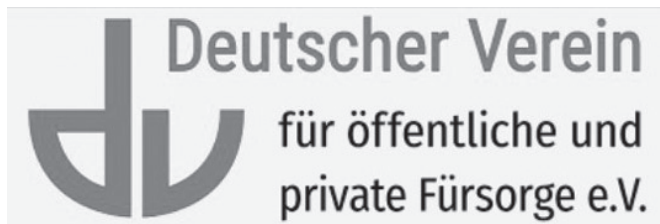
Logo Deutscher Verein für öffentliche und private Fürsorge e.V.

Der Deutsche Verein sieht gleichwohl, dass es angesichts steigender Kosten sowie des sich verschärfenden Arbeits- und Fachkräftemangels dringend geeigneter Lösungsansätze bedarf, um die Eingliederungshilfe verlässlich und wirksam für die Zukunft aufzustellen. In seinen Empfehlungen zur Weiterentwicklung der Eingliederungshilfe für Menschen mit Behinderungen unterbreitet der Deutsche Verein konstruktive Vorschläge zum Bürokratieabbau und einer